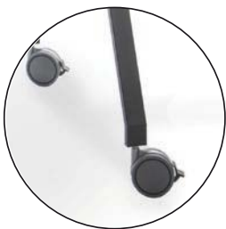
Ruedas robustas de alta calidad para una máxima movilidad.