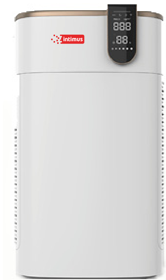
Panel táctil y control remoto