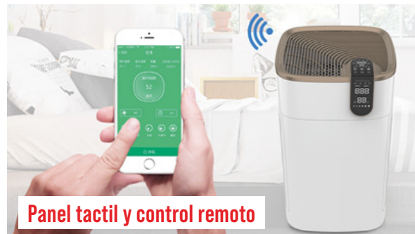
Panel táctil y control remoto