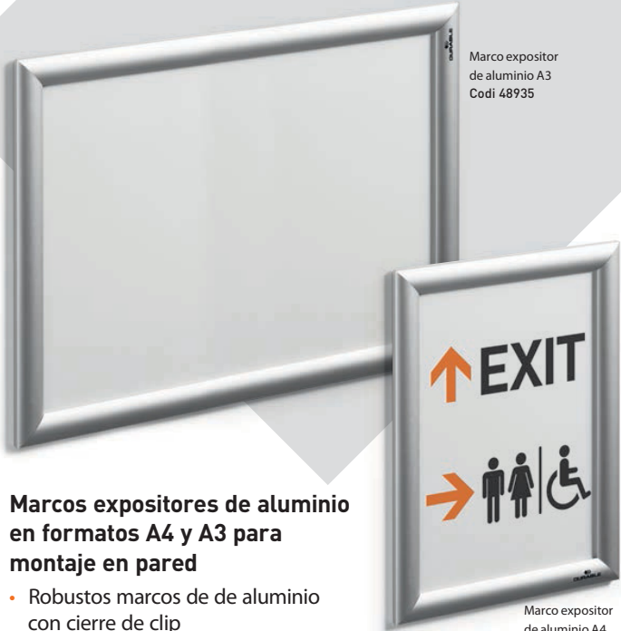
Marco expositor de aluminio A3 Codi 48935