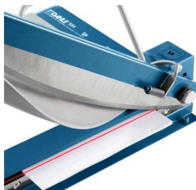
La indicación precisa del corte por medio de rayo láser proporciona resultados de corte profesionales