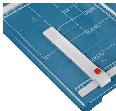
Tope posterior regulable para la detección rápida del formato, aplicable en ambos topes angulares