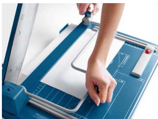
Plancha de prensado manual para una óptima fijación del material