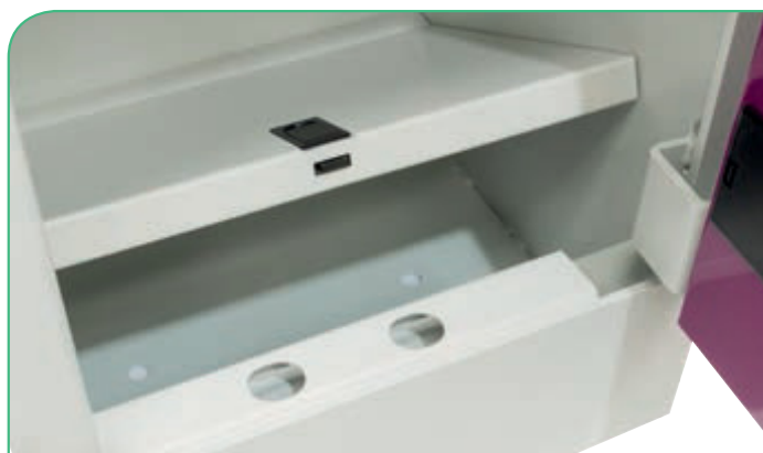
Dispone de cajón interior en el zócalo para un máximo aprovechamiento del espacio