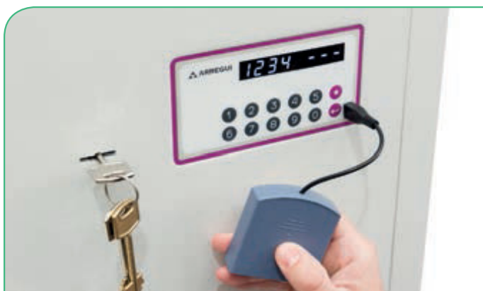
Toma de corriente externa tipo micro USB