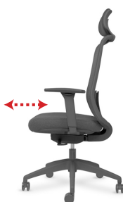
Profundidad de asiento