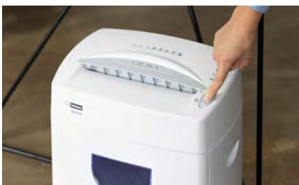
Función de inicio/parada automática y tecnología anti-atasco de papel.