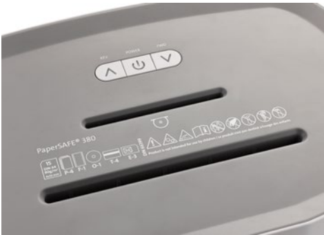
Destrucción de documentos DAHLE PaperSAFE® 380