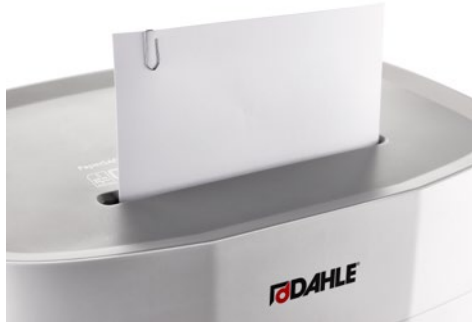
Destrucción de documentos DAHLE PaperSAFE® 380