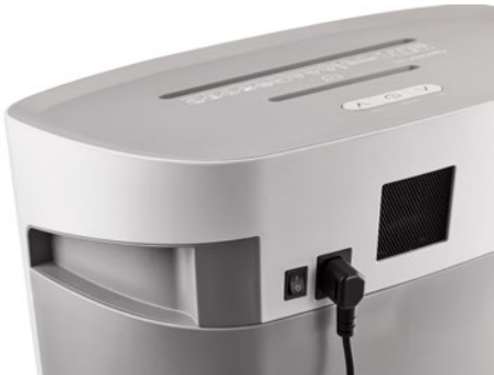
Destrucción de documentos DAHLE PaperSAFE® 380