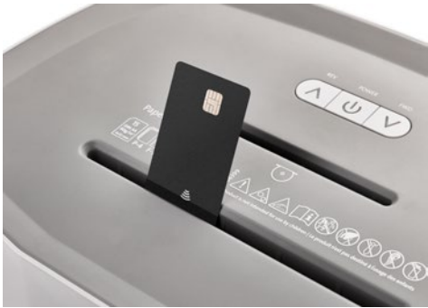
Destrucción de documentos DAHLE PaperSAFE® 380