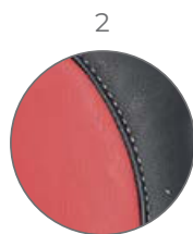
2 Rojo / Red Rot / Rouge