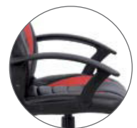
Brazos fijos Fixed armrest