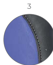
3 Azul / Blue Blau / Bleu