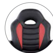
PU transpirable Breathable PU